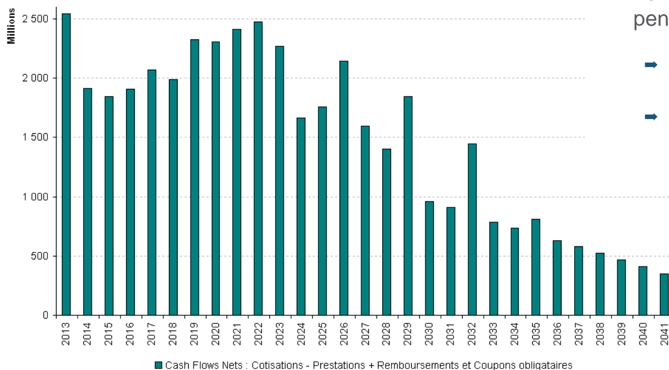
Flux annuels net (M€)