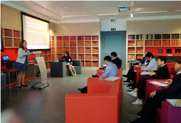
比利时联邦社会保障公共服务部

在布鲁塞尔，代表团受到了比利时联邦社会保障公共服务部的接待。在此，代表团与比方交流了下列问题：1) 社会保障筹资的挑战；如何在人口老龄化背景下解决养老金的可持续性以及如何为社保长期可持续性建模；2) 比利时的社保筹资：社保强制缴费征集与社保遵缴、欺诈问题。