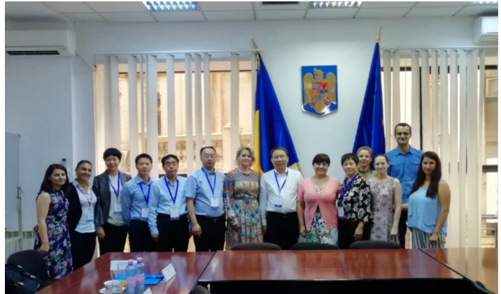
罗马尼亚劳动与社会正义部国务委员叶列娜·索罗摩内尼克女士举行仪式欢迎代表团一行

在布加勒斯特，代表团访问了罗马尼亚劳动与社会正义部。在此，他们学习了罗马尼亚社保体系的相关内容：社会服务、社会福利、就业、预算规划等；代表团也访问了国家支付与社会监察署。在此，他们讨论了预算规划问题与社会监察程序。代表团还访问了国家公共养老金局。在此，宾主就养老金体系的组织、功能和改革问题进行了交流。最后，代表团访问了帕萨瑞阿修道院。在此，他们可以亲身体验向老人提供社会服务及应对老年贫困是如何进行的。