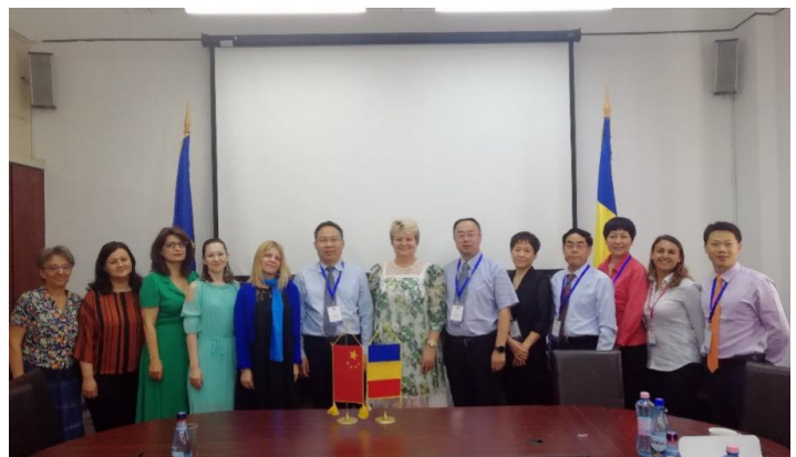
罗马尼亚国家支付与社会监察署